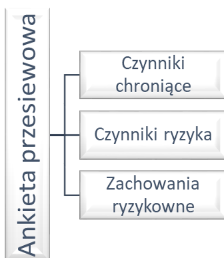
Ryc. 2. Pierwszy etap diagnozy – przesiewowy

Grupa wysokiego ryzyka zostanie wyróżniona poprzez specjalnie opracowany indeks zachowań ryzykownych (ryc. 1). Na indeks ten składać się będą następujące zmienne: