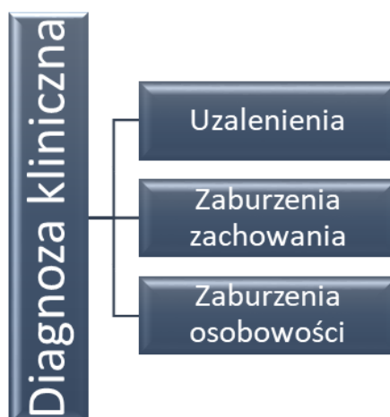
Ryc. 3. Trzeci etap diagnozy – pogłębiony, ukierunkowany na młodzież dysfunkcyjną

Wiedza uzyskana z drugiego etapu analiz diagnostycznych pozwoli na ukierunkowanie diagnozy na specyfikę zaburzeń młodzieży (ryc. 3). W zależności od dominujących problemów (scharakteryzowanych w pierwszym etapie diagnozy) zostaną zastosowane metody badań psychologicznych – sprofilowane pod rodzaje zaburzeń i teorię wyjaśniającą ich powstanie (epidemiologię).